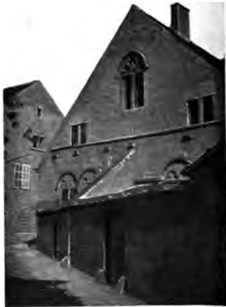
Maison du Chapitre.

L'art roman est représenté à Beaune par plusieurs morceaux intéressants, le portail de la Chapelle des Templiers , situé dans le faubourg Saint-Jacques, et celui de l' église Saint-Nicolas , une modeste église à